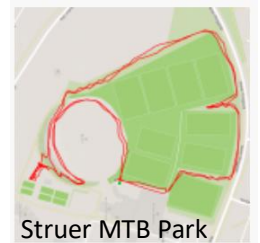
Struer MTB Park